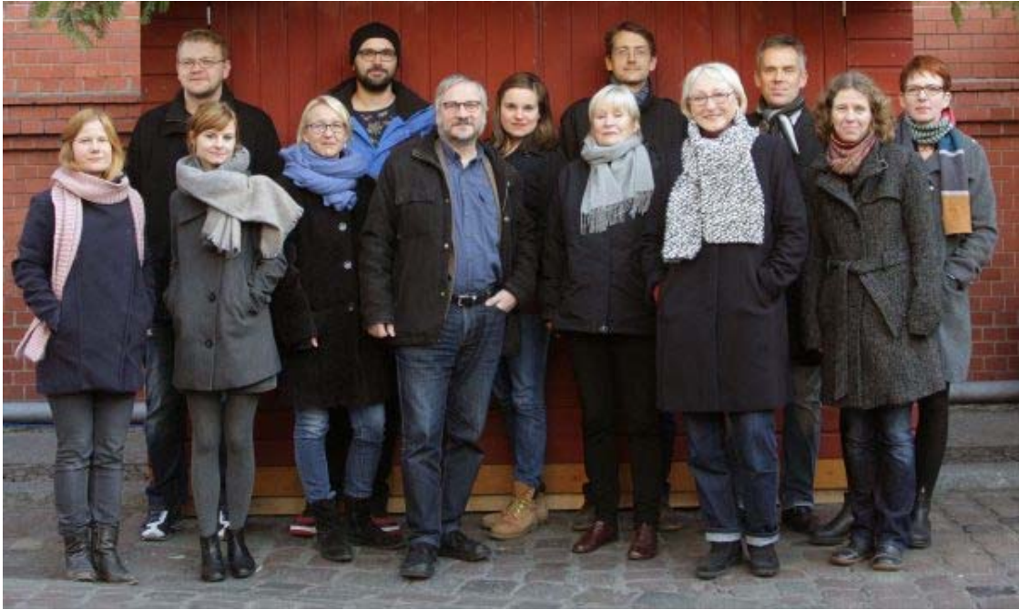
Das Verlagsteam, Winter 2016